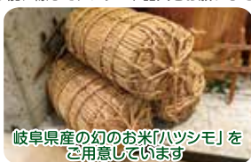
岐阜県産の幻のお米「ハツシモ」を ご用意しております